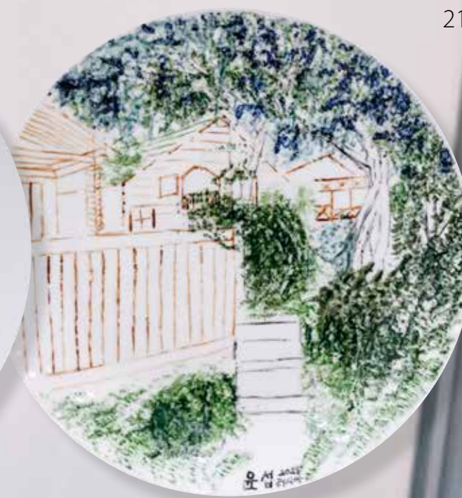
Веранда. Декоративная тарелка ø25,5. Фарфор, надглазурная роспись