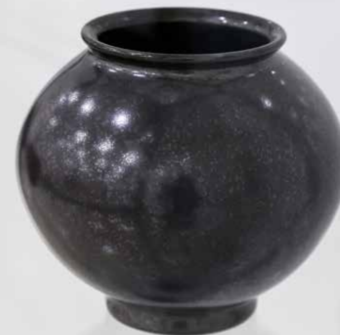
Ваза. Керамика, глазури, дровяной обжиг «редукция», 10 конус