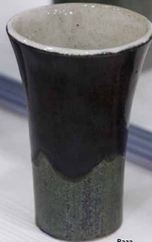
Ваза. Керамика, глазури, дровяной обжиг «редукция», 10 конус