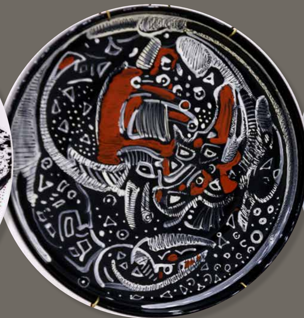
Краб. Декоративная тарелка ø25,5. Фарфор, надглазурная роспись