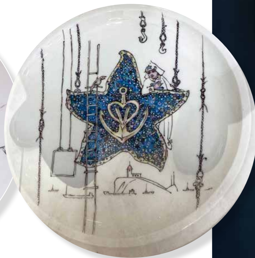
Друзья. Из серии «Влад и восток». Декоративная тарелка ø25,5. Фарфор, надглазурная роспись