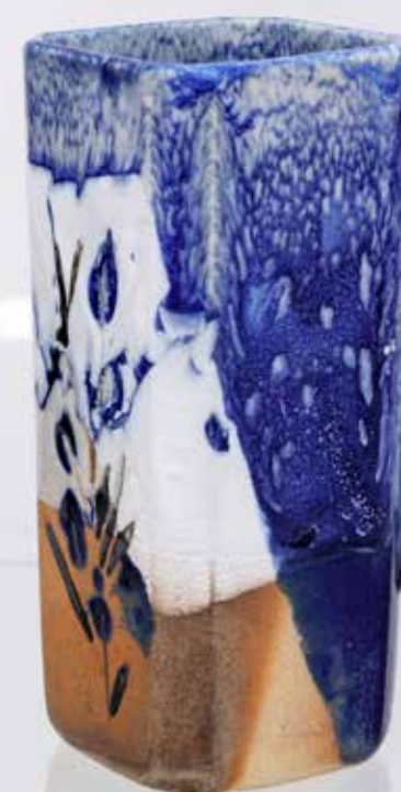
Ваза. Керамика, глазури, дровяной обжиг «редукция», 10 конус