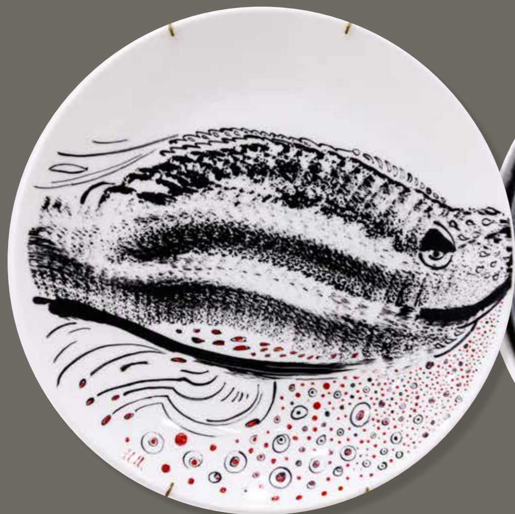
Нерест. Декоративная тарелка ø25,5. Фарфор, надглазурная роспись