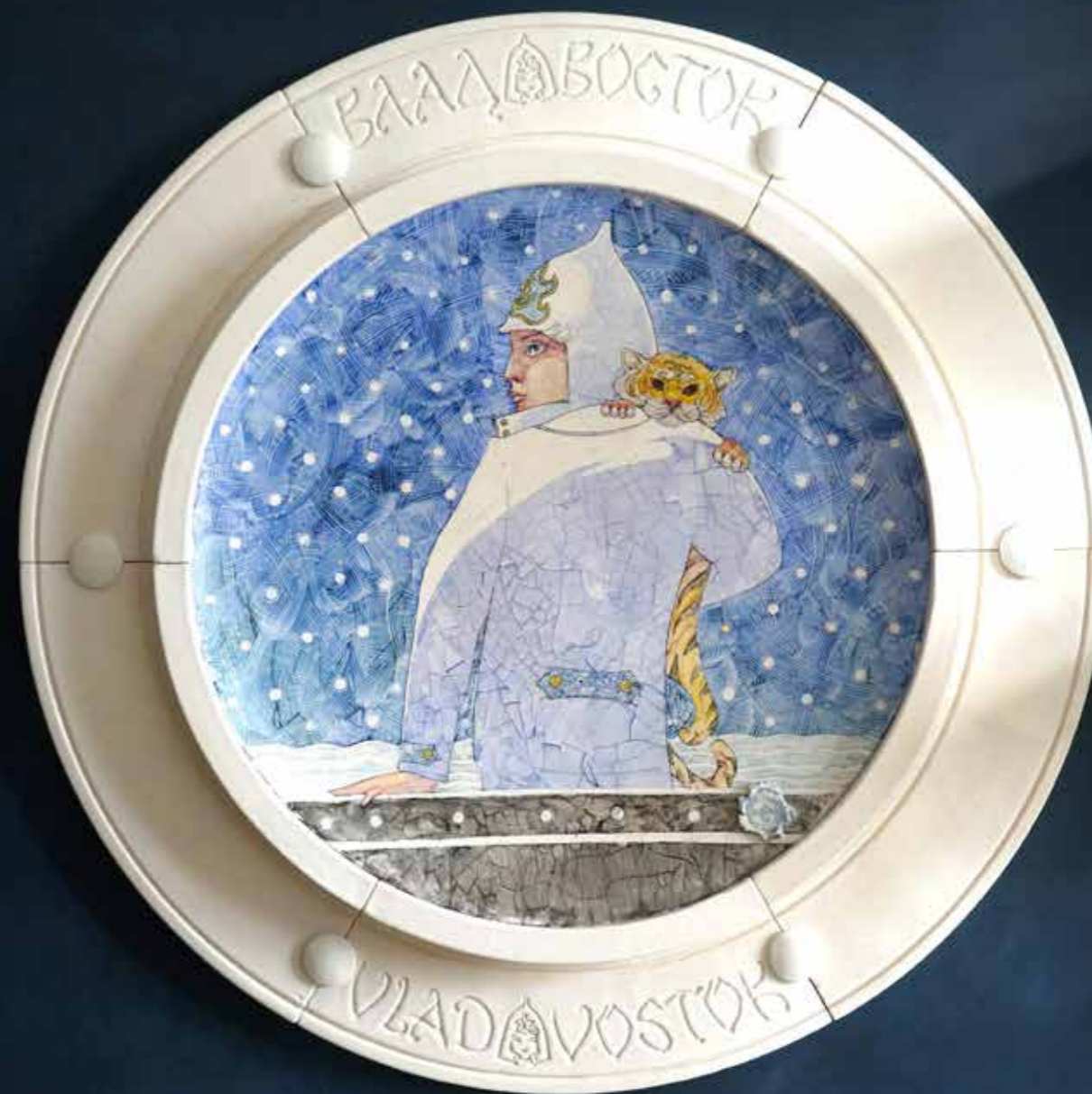
Влад. Из серии «Влад и восток». Декоративное панно. Фарфор, надглазурная роспись