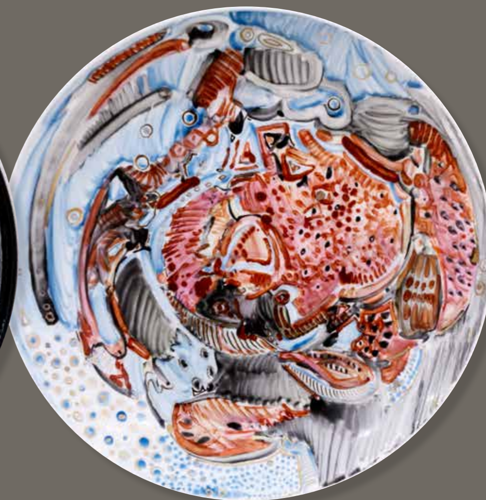
Краб. Декоративная тарелка ø25,5. Фарфор, надглазурная роспись