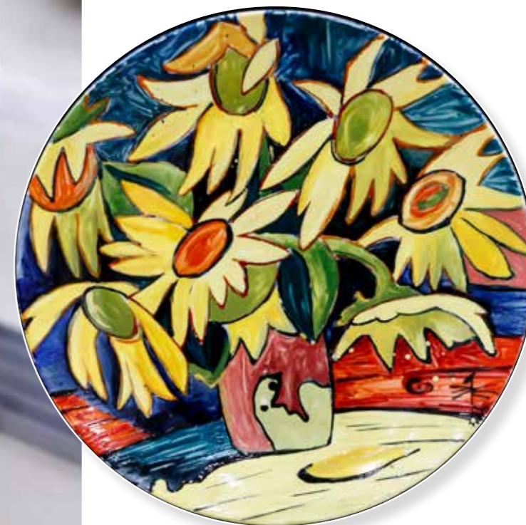
Подсолнухи. Декоративная тарелка ø25,5. Фарфор, надглазурная роспись