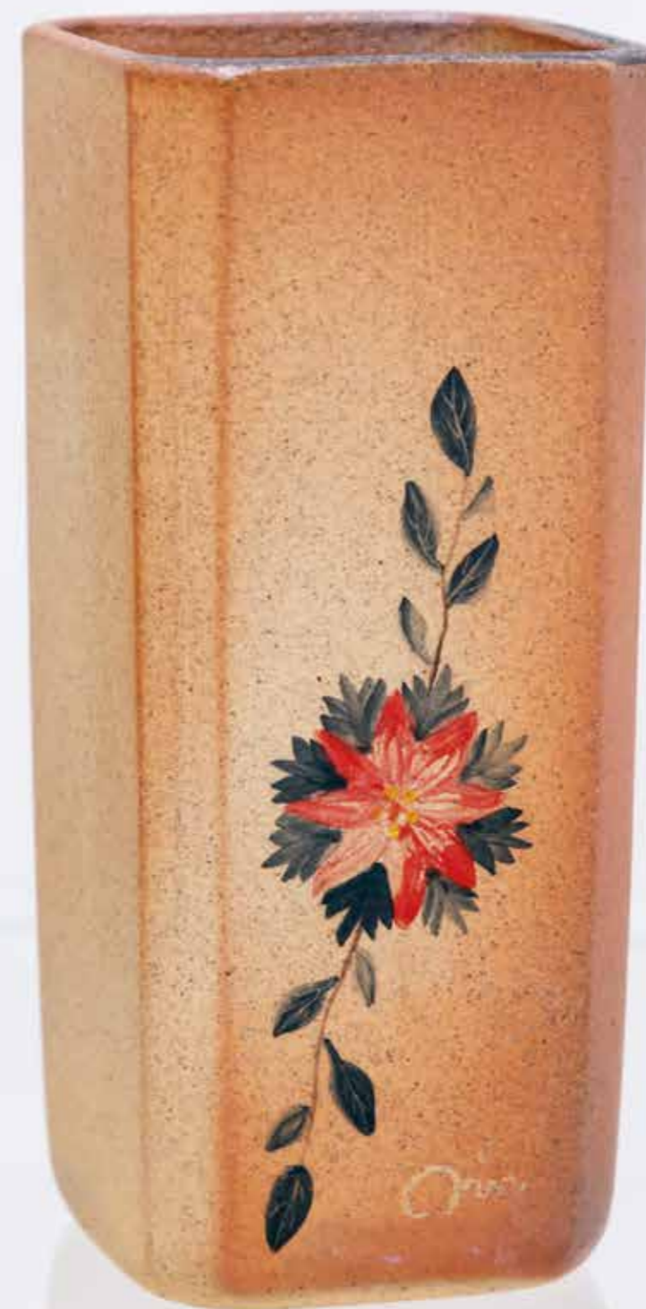
Ваза. Керамика, глазури, дровяной обжиг «редукция», 10 конус