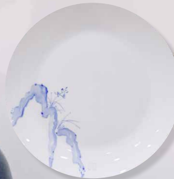
Длинная волна. Декоративная тарелка ø25,5. Фарфор, надглазурная роспись

Автор лекций о керамики в университете Квандон.