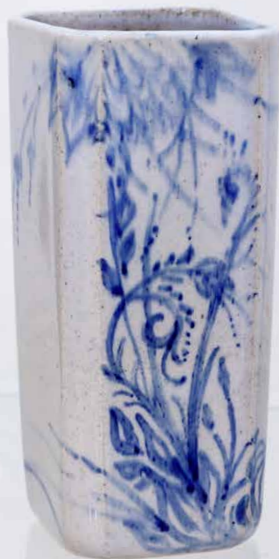
Ваза. Керамика, глазури, дровяной обжиг «редукция», 10 конус

Почётный консультант Художественного музея г. Нинбо (КНР) в области русского искусства, эксперт по культурным ценностям Министерства культуры Российской Федерации.