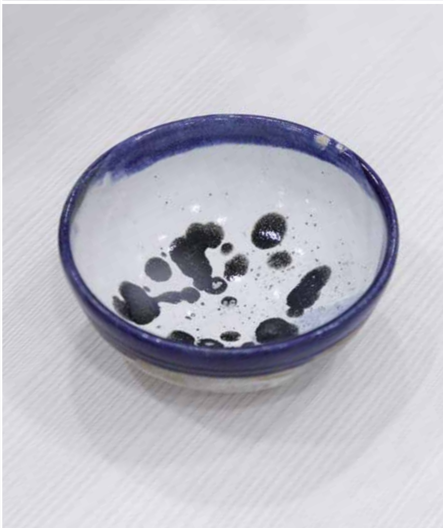
Пиала. Керамика, глазури, дровяной обжиг «редукция», 10 конус