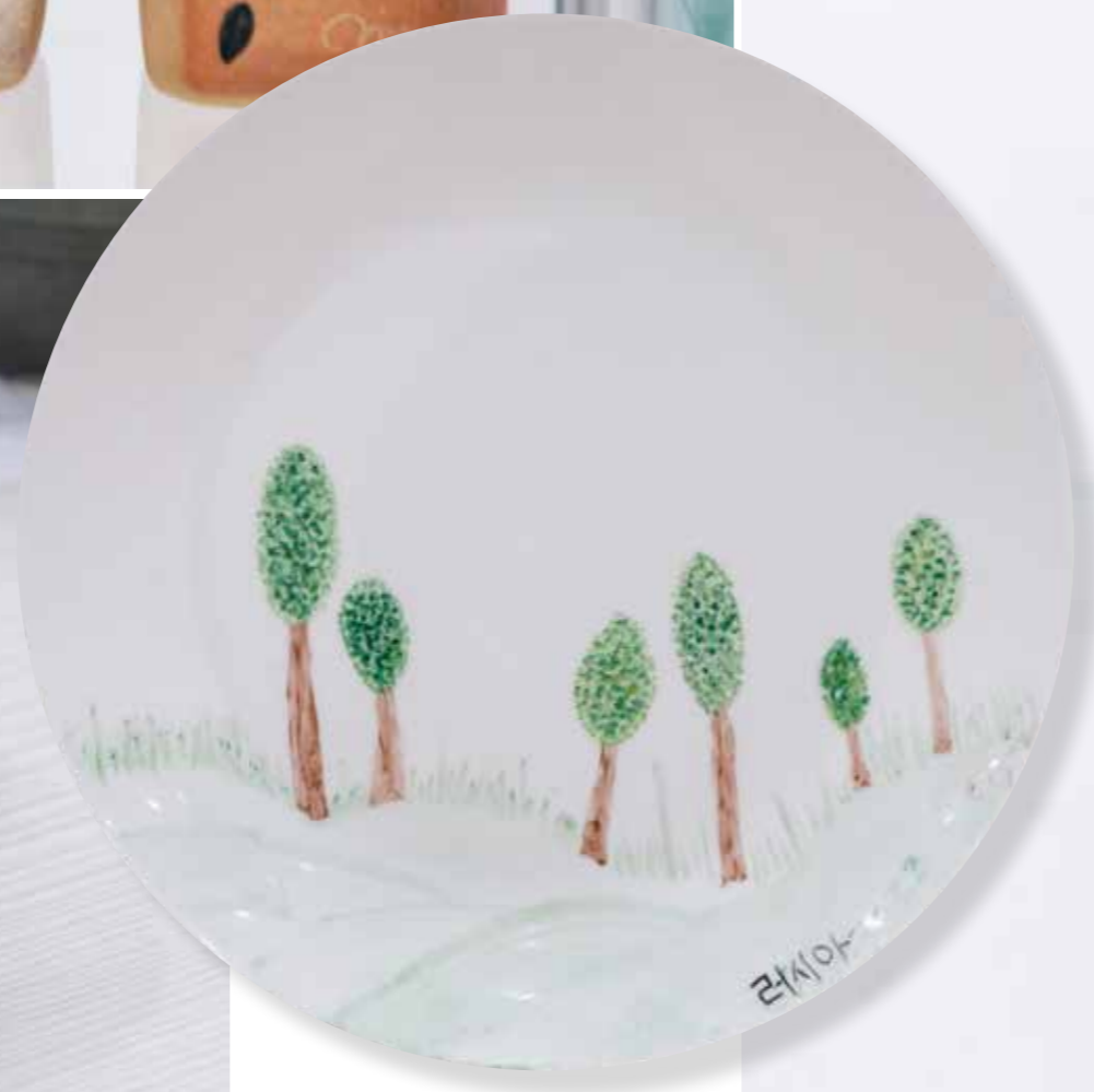
Приглашение. Декоративная тарелка \varnothing 25,5 . Фарфор, надглазурная роспись