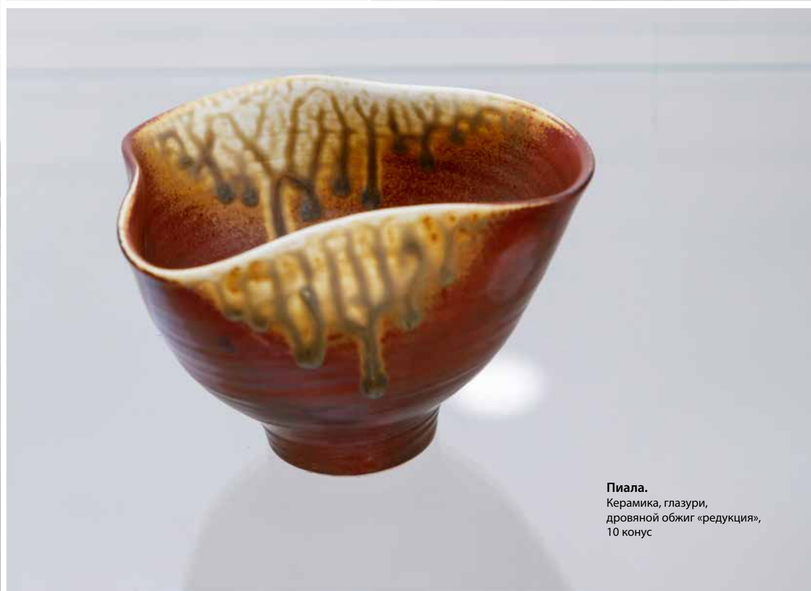
Пиала. Керамика, глазури, дровяной обжиг «редукция», 10 конус