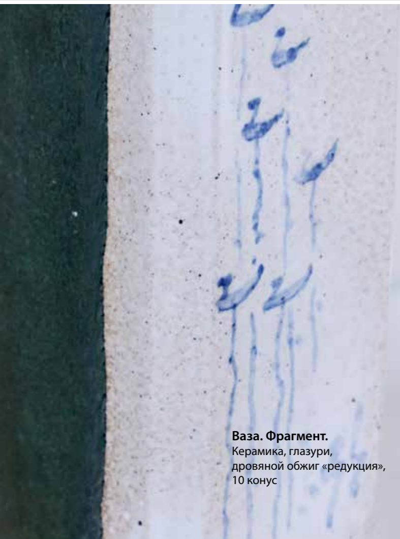
Ваза. Фрагмент. Керамика, глазури, дровяной обжиг «редукция», 10 конус