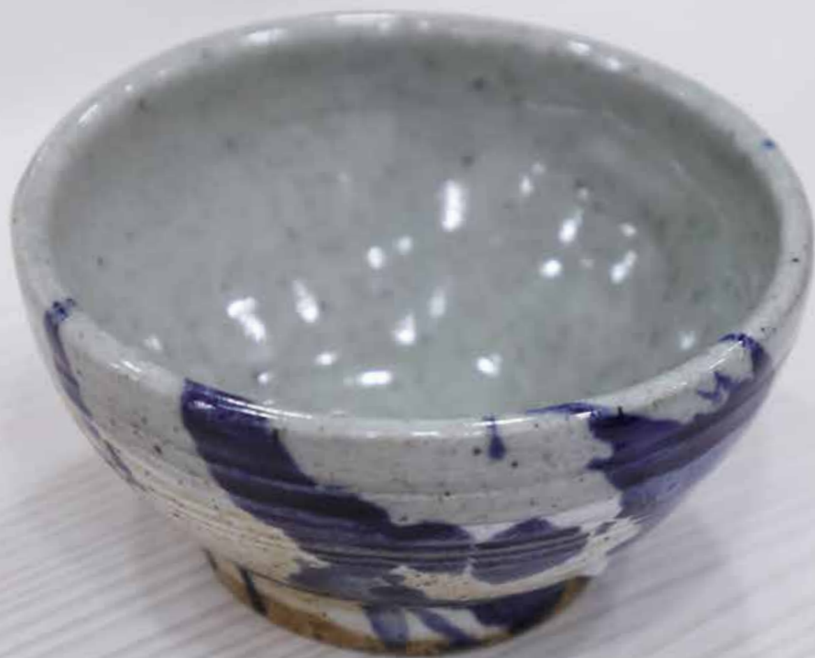
Пиала. Керамика, глазури, дровяной обжиг «редукция», 10 конус

Художник декоративно-прикладного искусства, живописец, художник театра. Участник городских и краевых художественных выставок. Сотрудник мастерской художественной керамики и современных технологий моделирования Центра исполнительских и визуальных искусств ДВГИИ, Владивосток.