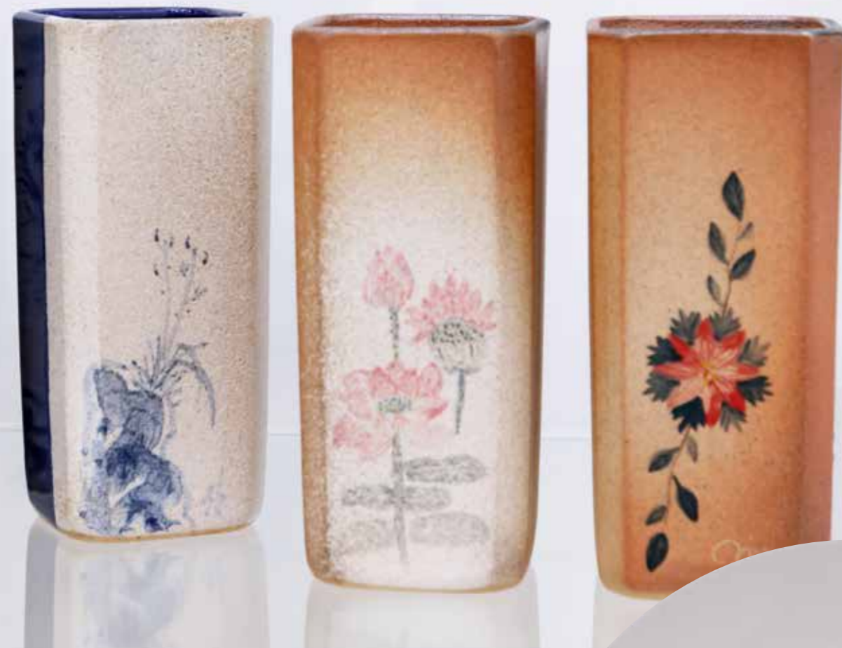
Вазы. Керамика, глазури, дровяной обжиг «редукция», 10 конус