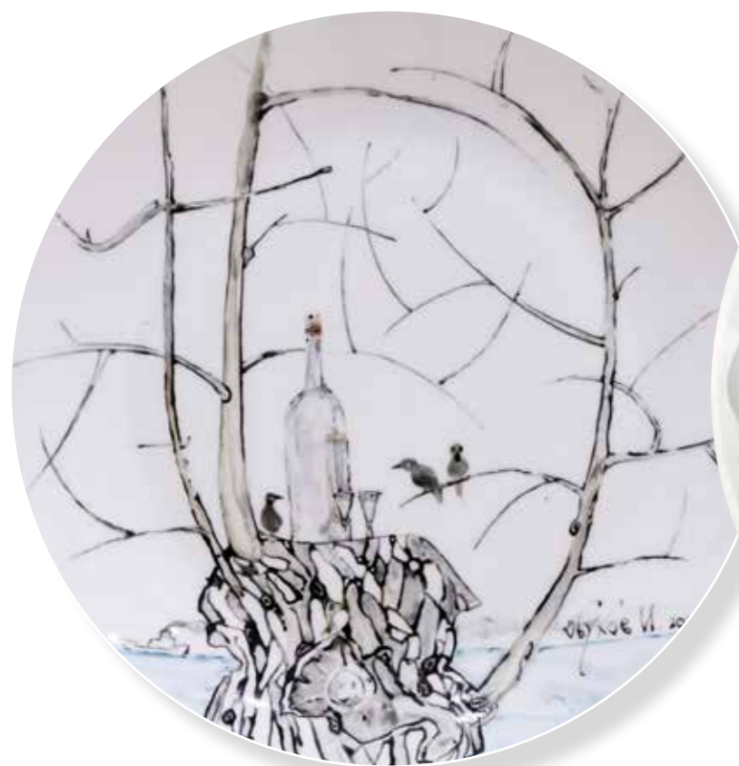
Чижик-Пыжик. Декоративная тарелка ø25,5. Фарфор, надглазурная роспись

Участник и лауреат многочисленных российских и международных выставок.