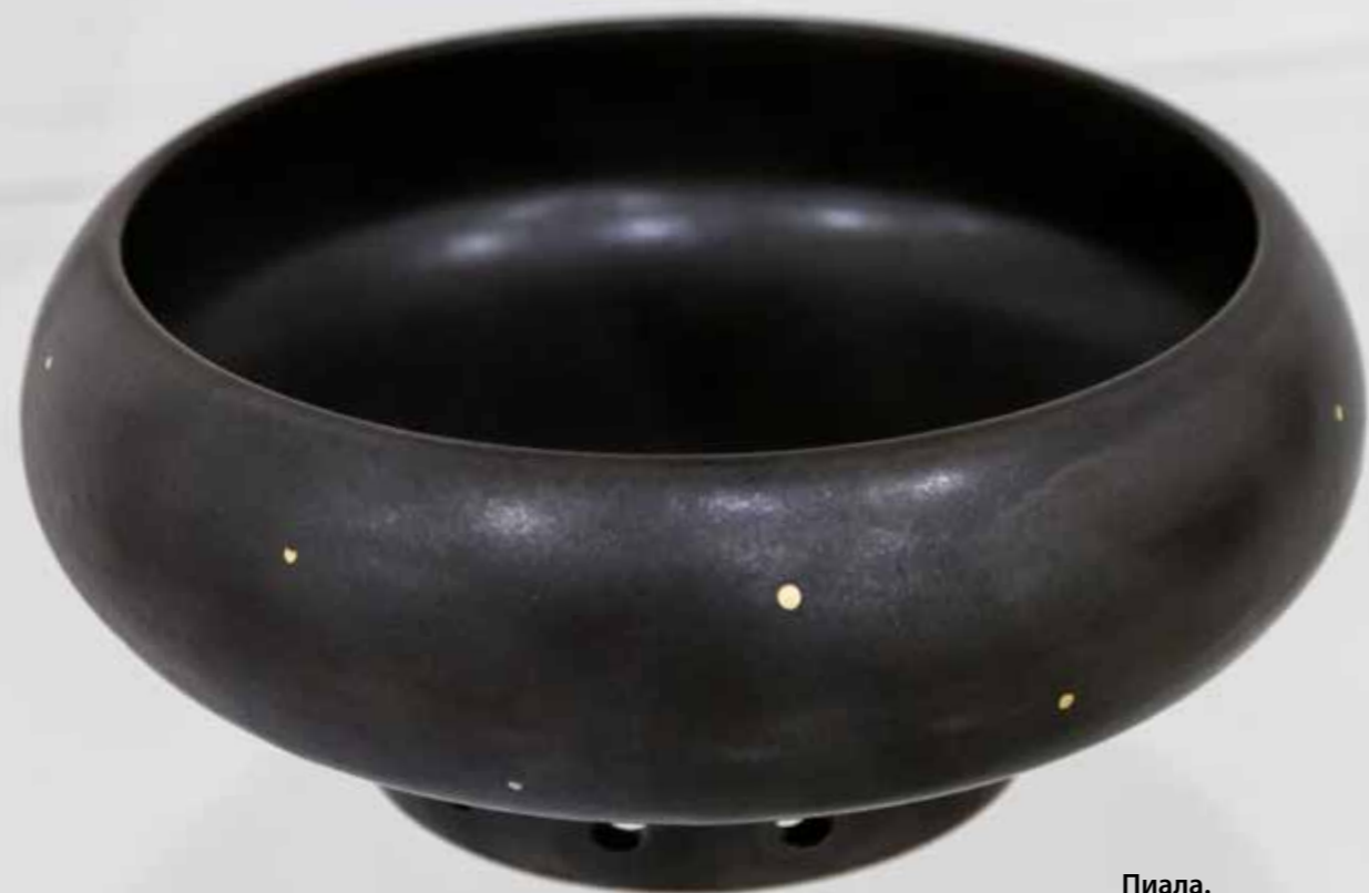
Пиала. Керамика, глазури, дровяной обжиг «редукция», 10 конус