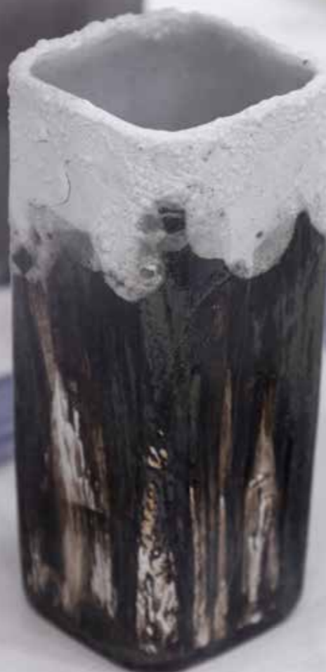
Ваза. Керамика, глазури, дровяной обжиг «редукция», 10 конус