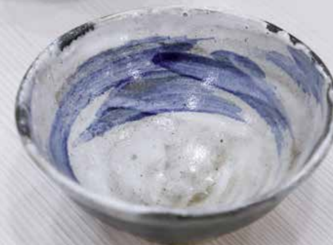
Пиала. Керамика, глазури, дровяной обжиг «редукция», 10 конус