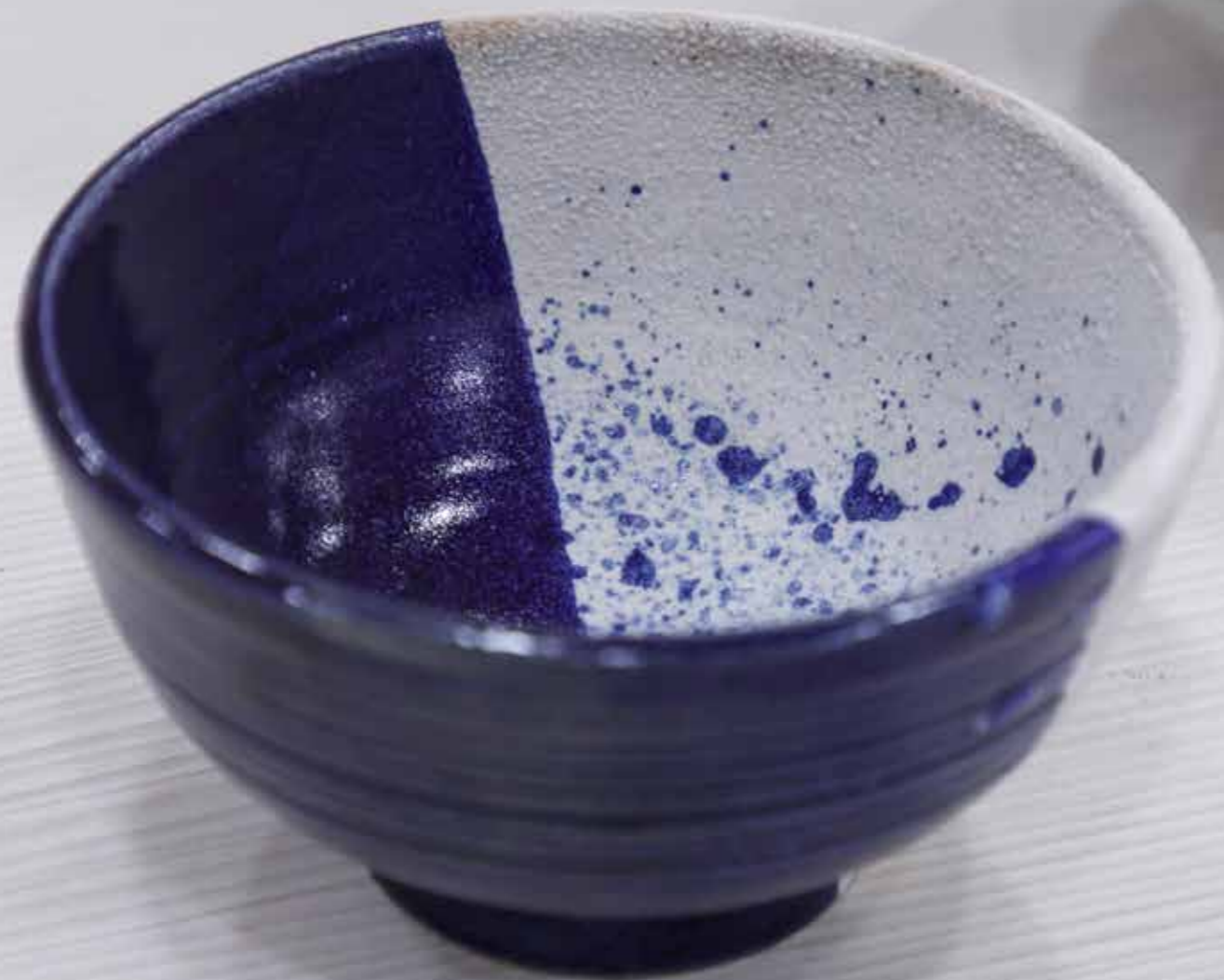
Пиала. Керамика, глазури, дровяной обжиг «редукция», 10 конус