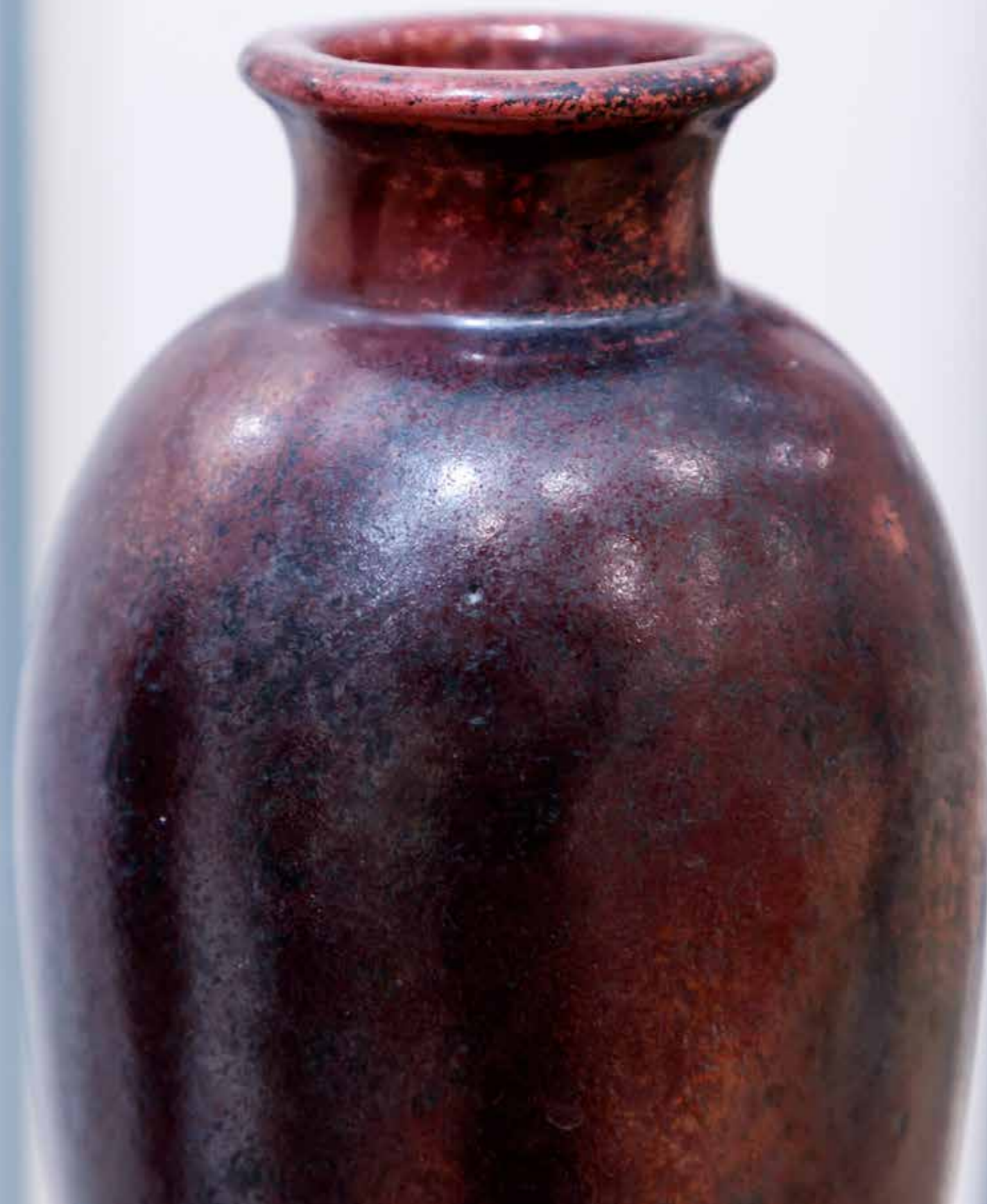
Ваза. Керамика, глазури, техника «Раку»