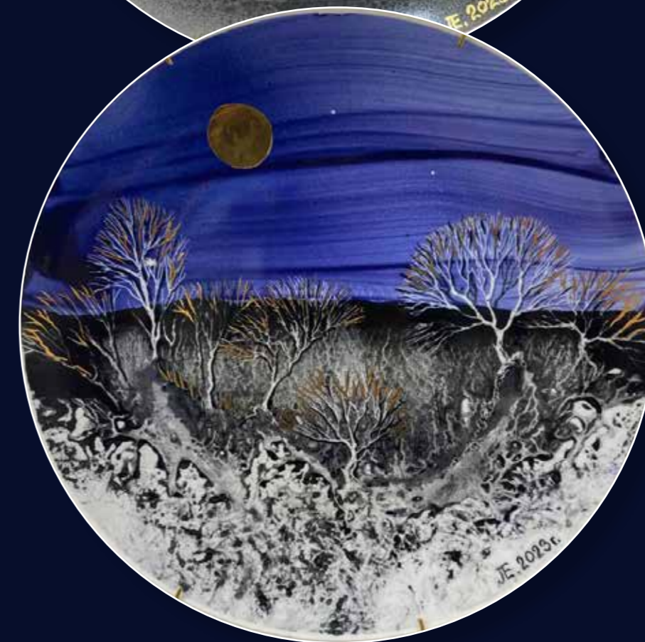
Серия «Ночные мотивы». Декоративные тарелки \varnothing 25,5 . Фарфор, надглазурная роспись, золото