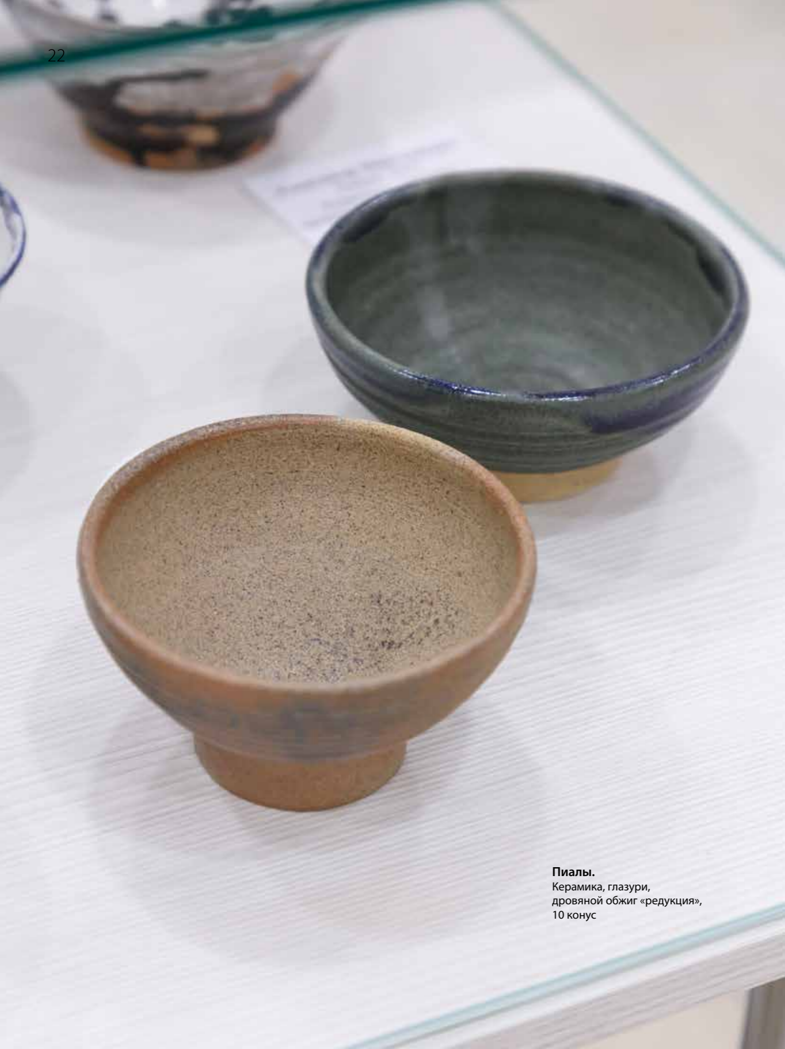
Пиалы. Керамика, глазури, дровяной обжиг «редукция», 10 конус