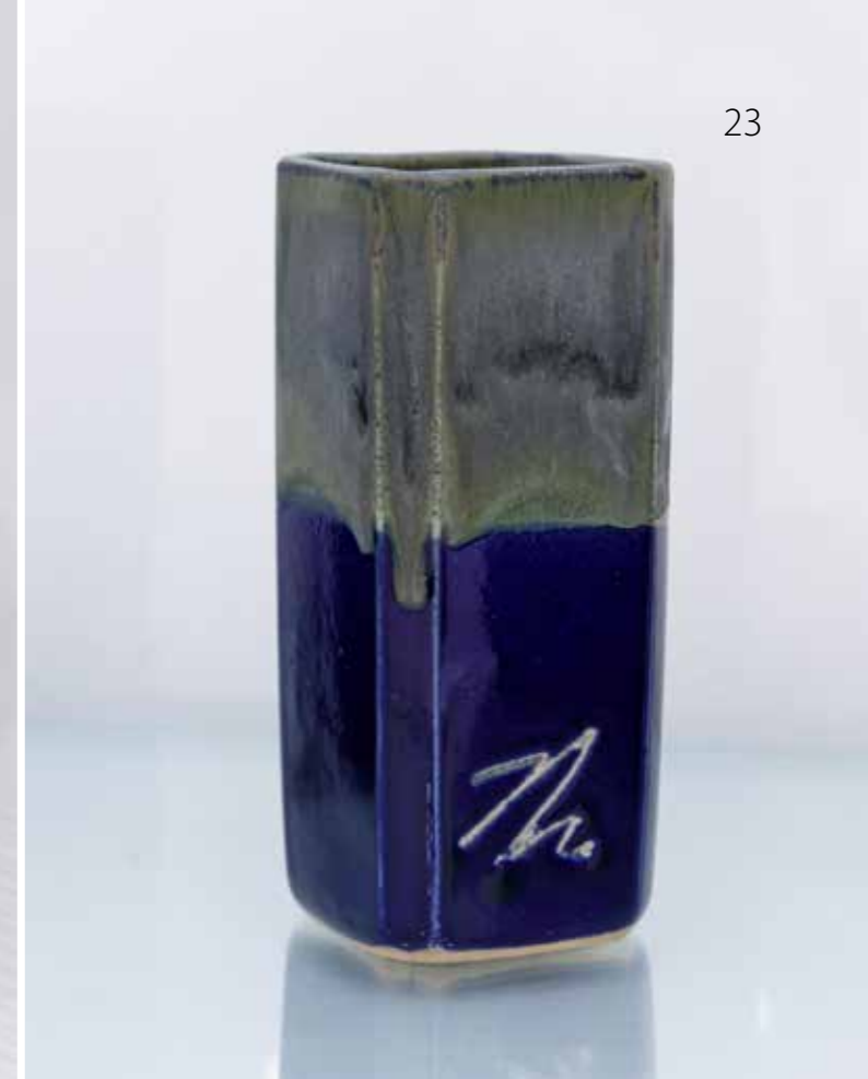
Вазы. Фрагмент. Керамика, глазури, дровяной обжиг «редукция», 10 конус