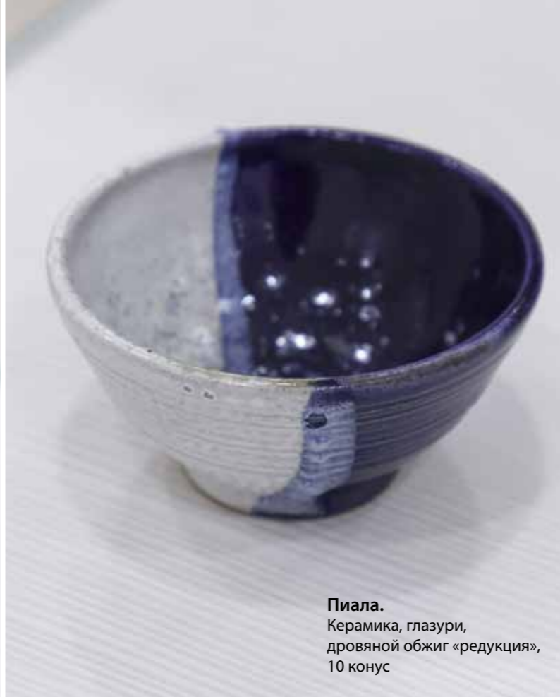
Пиала. Керамика, глазури, дровяной обжиг «редукция», 10 конус