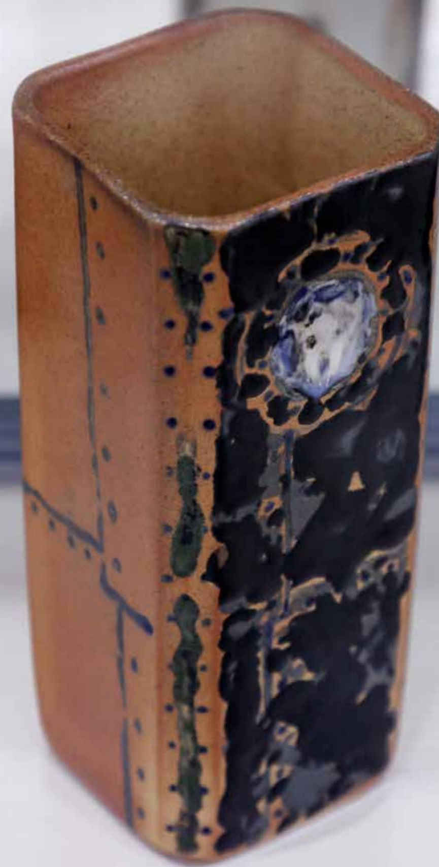
Ваза. Керамика, глазури, дрвяной обжиг «редукция», 10 конус