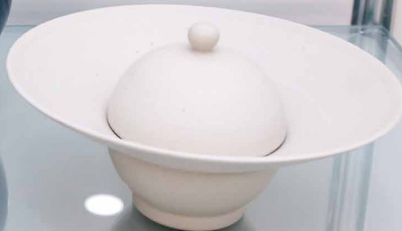
Вазы. Керамика, глазури, дровяной обжиг «редукция», 10 конус