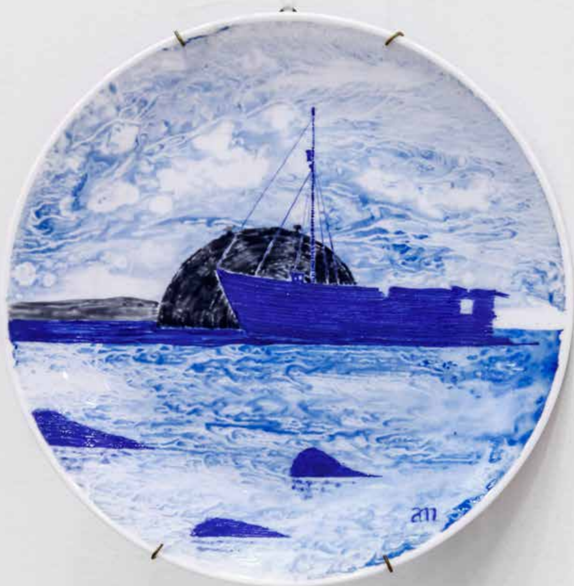
Бухта Витязь. Декоративная тарелка \varnothing 25,5 . Фарфор, надглазурная роспись

Художник декоративно-прикладного искусства, живописец, художник театра. Участник международных, городских и краевых художественных выставок. Технолог мастерской художественной керамики и современных технологий моделирования Центра исполнительских и визуальных искусств ДВГИИ, Владивосток.