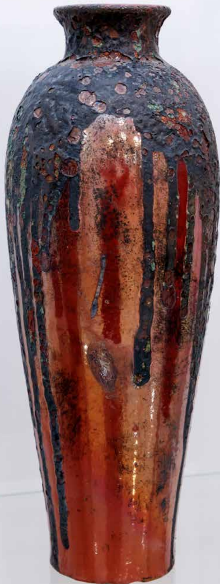
Ваза. Керамика, глазури, техника «Раку»