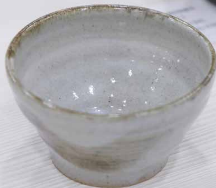
Пиала. Керамика, глазури, дровяной обжиг «редукция», 10 конус